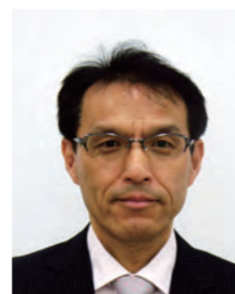
阪神南県民センター 長

新年あけましておめでとうございます。 尼崎青年会議所の皆様方には、輝かしい新春を健やかに迎えの心からお慶び申し上げます。 皆様方には日頃から、本市の発展を目指し、地域に密着したさまざまな活動にご尽力いただいておりますことに、深く敬意を表しますとともに、厚く御礼申し上げます。本市では、平成28年に迎える市制100周年に向け、テーマを「100周年 知れば知るほどあまがさき♥」と定め、全市が一体となって100周年記念事業を推進するための基本方針を策定するなど、鋭意取り組みを進めているところです。この大きな節目となる市制100周年を意義あるものにするためには、市民の皆様と事業者の皆様、そして行政がそれぞれ知恵を出し合うとともに、互いに連携していくことが不可欠です。皆様方におかれましては、どうか今後とも、本市のまちづくりを引き続きご支援とご協力を賜りますようお願い申し上げます。 最後になりましたが、皆様方にとりまして、この一年が充実した素晴らしい年になりますとともに、貴会議所のさらなるご発展並びに皆様方のご活躍を祈念いたします。