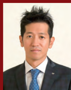
56th Generation president