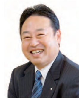
尼崎青年会議所シニアクラブ 会長

新年あけましておめでとうございます。 平成12年尼崎青年会議所の皆様方が尼崎の環境キャラクターとして「エコあま君」の製作を提唱し、翌年「エコクラブ」を創設されました。青年会議所の取組を単年度ではなく継続したものにするため「子どもたちと夢を語るまち」を目指し、エコあま君と共に次のような活動を積み重ねております。 ①市内支所等・学校・事業所での古紙回収 ②古紙リサイクルによる「エコロール」販売 ③エコあま君基金を利用した青少年事業 ④古紙リサイクルの出前授業 ⑤「あまらぶ」「あまなび」「あまがさきっていいな!」等冊子への制作協力 今後とも、活動へのご協力をお願いしますと共に、尼崎青年会議所の皆様にとって、より一層素晴らしい青年会議所活動、運動となる一年となりますことをお祈りし、年頭のご挨拶とさせていただきます。